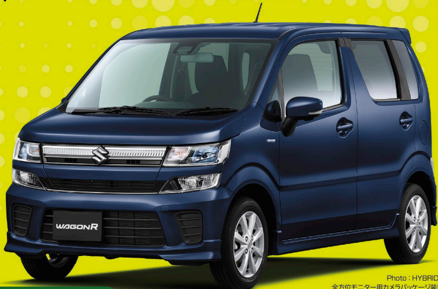
Photo: HYBRID FZ 全方位モニター用カメラパッケージ装着車 ボディカラーはノクターンブルーパール