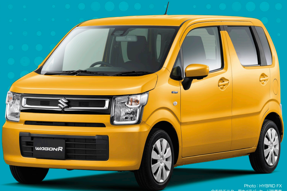
Photo: HYBRID FX 全方位モニター用カメラパッケージ装着車 ボディカラーはアクティブイエロー